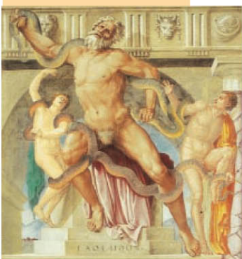
Papacello, Particolari da La Battaglia del Trasimeno e Laocöone